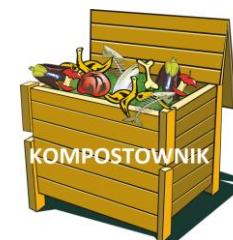
KOMPOSTOWNIK ZAPEWNIĄ WŁAŚCICIEL