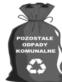
WORKI LUB POJEMNIK ZAPEWNIĄ WŁAŚCICIEL