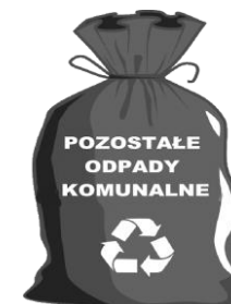
WORKI LUB POJEMNIK ZAPEWNIĄ WŁAŚCICIEL