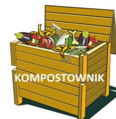
KOMPOSTOWNIK ZAPEWNIĄ WŁAŚCICIEL