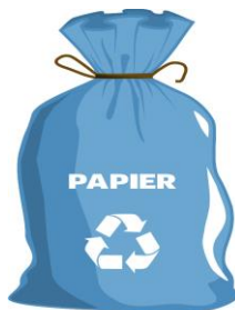
WORKI ZAPEWNIĄ ZM NATURA