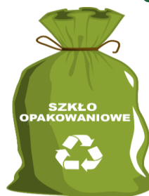
WORKI ZAPEWNIĄ ZM NATURA