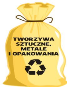
WORKI ZAPEWNIĄ ZM NATURA