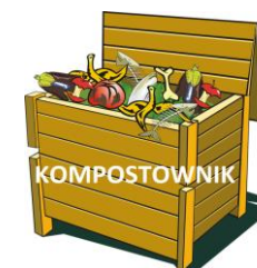
KOMPOSTOWNIK ZAPEWNIĄ WŁAŚCICIEL