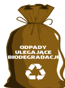
WORKI ZAPEWNIĄ ZM NATURA