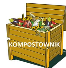
KOMPOSTOWNIK ZAPEWNIĄ WŁAŚCICIEL