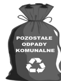
WORKI LUB POJEMNIK ZAPEWNIĄ WŁAŚCICIEL